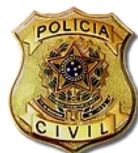
POLÍCIA CIVIL ALVARÁ DE TRANSPORTE