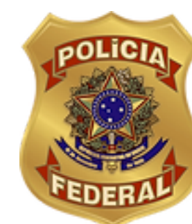
POLÍCIA FEDERAL CERTIFICADO DE LICENÇA DE FUNCIONAMENTO